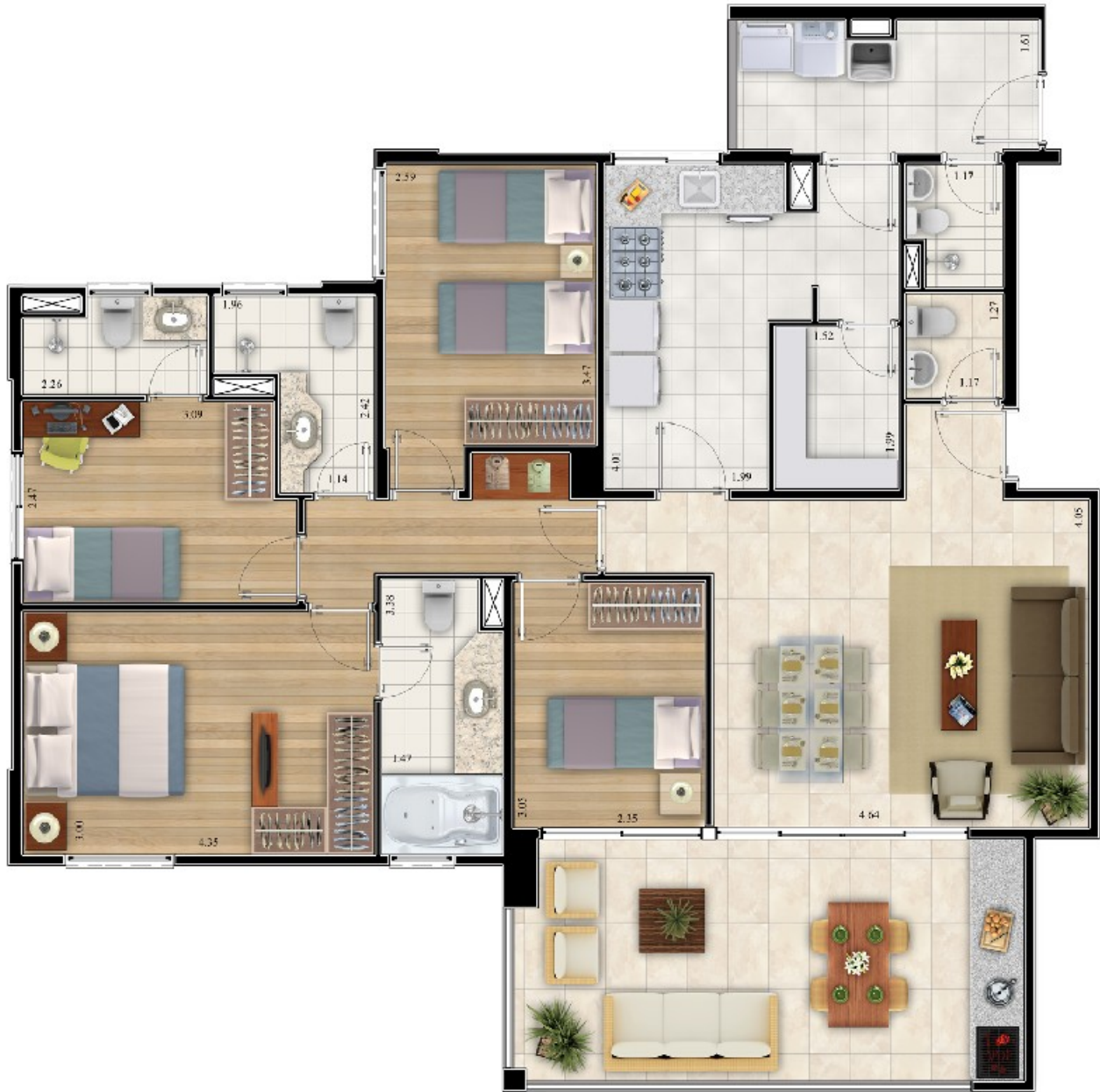
Planta tipo 130m 2

Material preliminar elaborado para treinamento interno. Sujeito a alterações. Divulgação proibida.